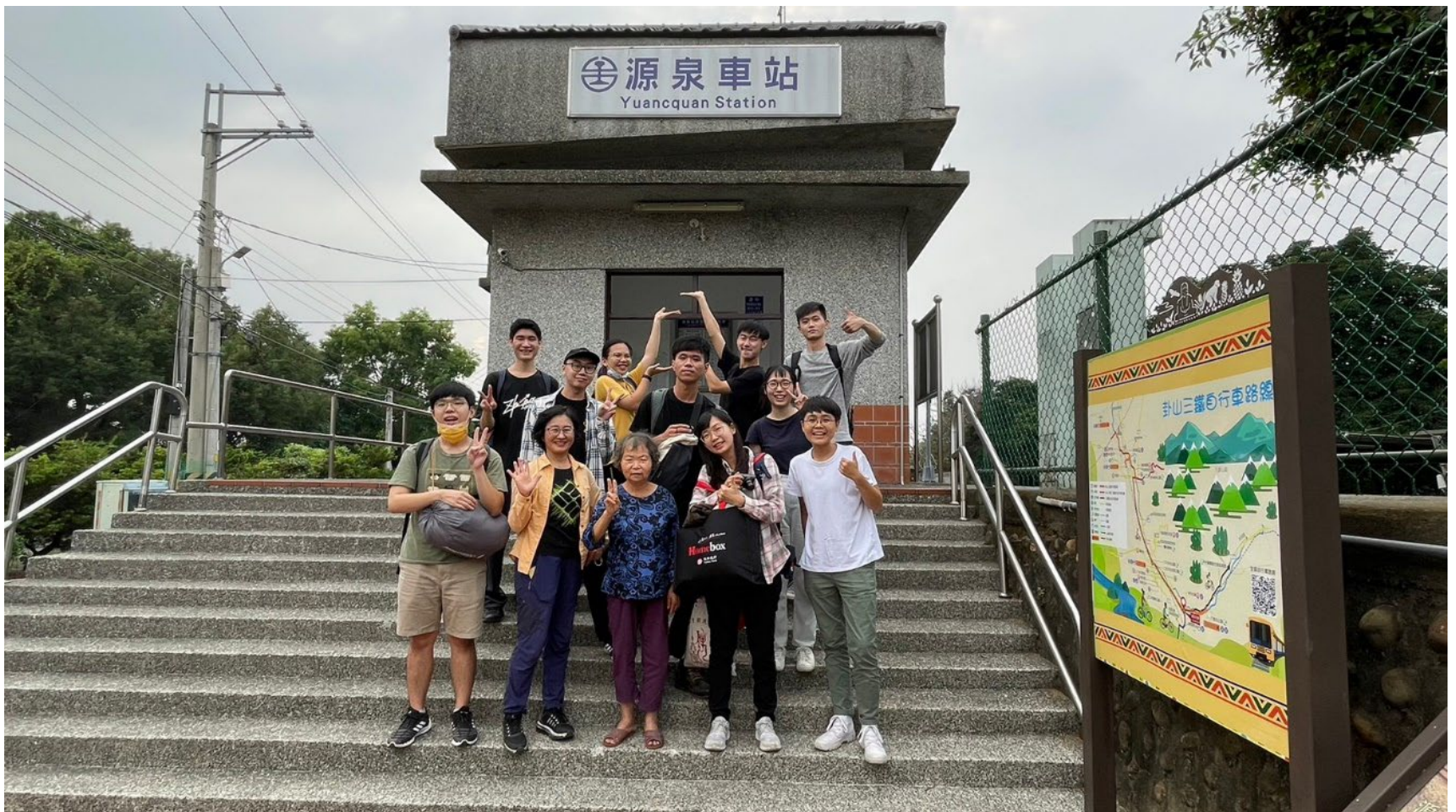
感謝這幾天遇見的所有人事物