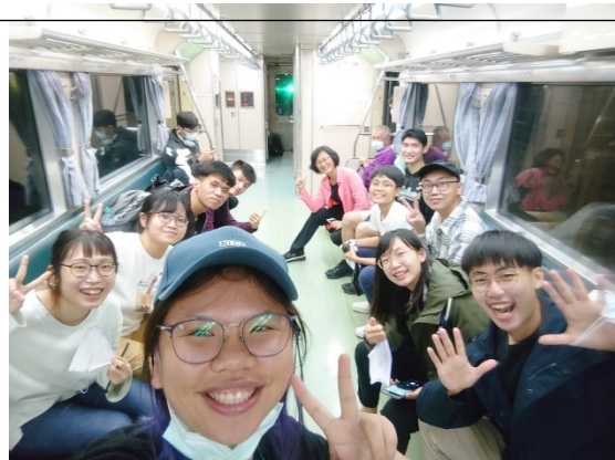
儘管大家有些疲憊，但在前往源泉的車廂內合照還是笑得很開心！

快速地走過幾條路，不出我所料，可以看見籤仔店、藥局、理髮廳、早餐店及機車行，這些維持日常生活所需的店家。不過都已打烊，只好先輕輕道聲晚安，明天見！