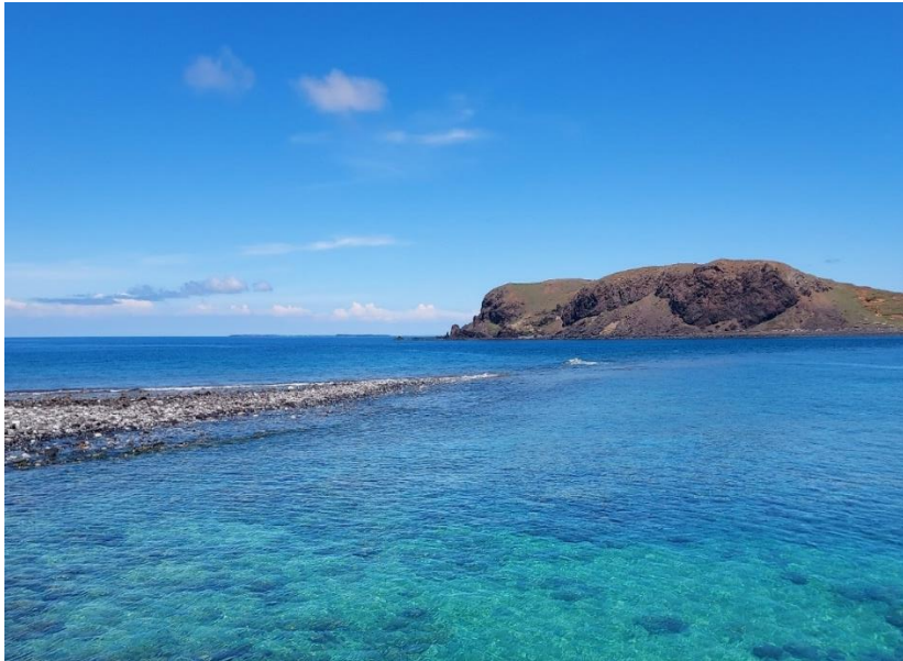
圖十 西嶼坪嶼東側延伸出去的淺礫石灘