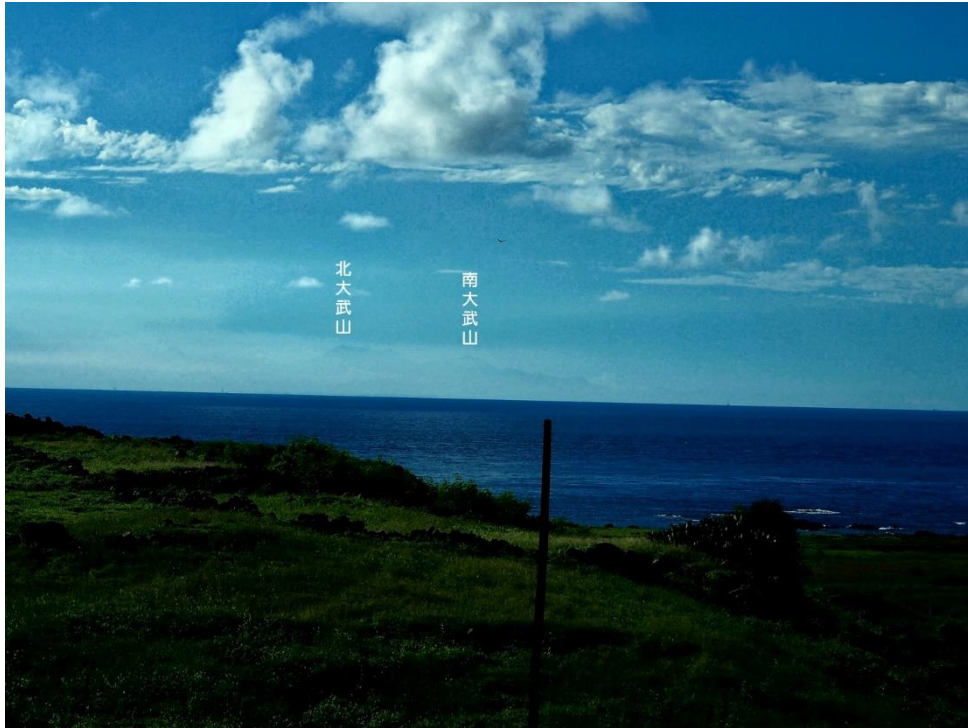
圖五 海平面上的臺灣北大武山與南大武山