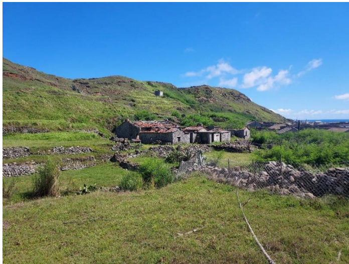
圖十一 沙溝仔澎湖「四樓頭」古厝