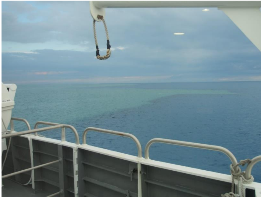
圖十二 臺灣海峽海面顏色分界明顯