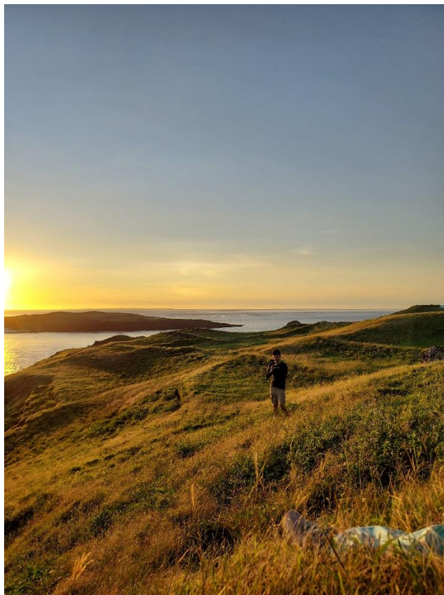
圖三 東吉夕照與踏查者，左後小島嶼為鋤頭嶼

把握太陽落下前的短暫時間，走上東吉嶼北側的八卦山山頂，因海底火山噴發形成的玄武岩島群，頂部是一片平坦，無明顯的高山起伏，在夕陽的照射下，我們靜靜地躺在草地上，被大海與夕照擁抱。