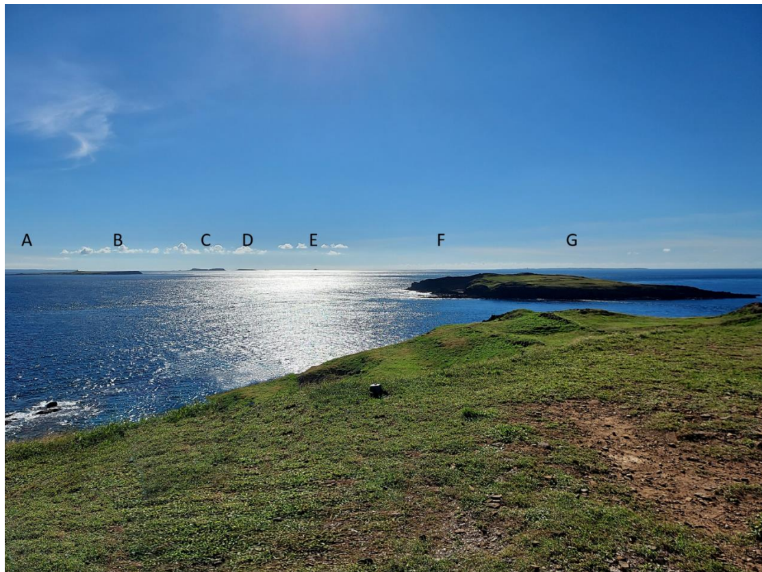
圖四 東吉嶼的周邊島嶼

標高僅 47 公尺的八卦山是東吉嶼的至高點，視野遼闊，可以把整個海域盡收眼簾。從最近的島上兵厝、碼頭和比鄰的鋤頭嶼，再到僅一水之隔的西吉嶼，將視野放遠能看到東、西嶼坪及諸邊島礁。站在山頂上，感受自己被周圍波濤洶湧的海洋給包圍。