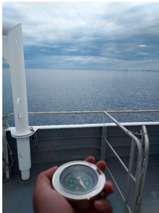
圖十三 船隻向辰巽方向前行，圖中島嶼由左至右分別為東吉嶼與鋤頭嶼