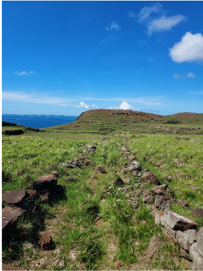
圖九 東嶼坪前山山頂步道，遠方為後山山坡梯田景觀